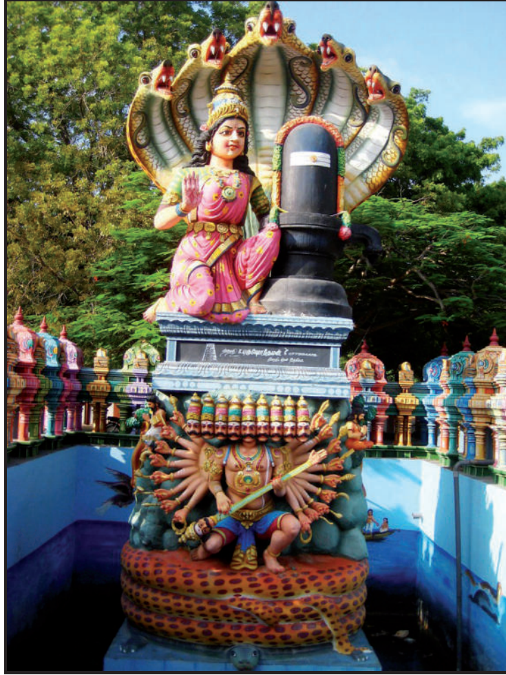
நயினை நாகபூசணி அம்மன் கோயிற் சிற்பம்

இந்த விடைத்தாள் பரீட்சைக்காரர்களின் உபயோகத்துக்காகத் தயாரிக்கப்பட்டது. பிரதம பரீட்சைக்காரர்களின் கலந்துரையாடல் நடைபெறும் சந்தர்ப்பத்தில் பரிமாறிக்கொள்ளும் கருத்துக்களுக்கிணங்க, இதில் உள்ள சில விடயங்கள் மாறலாம்.